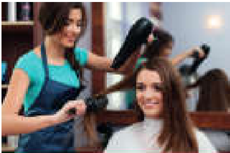
Shopping Princess Styling